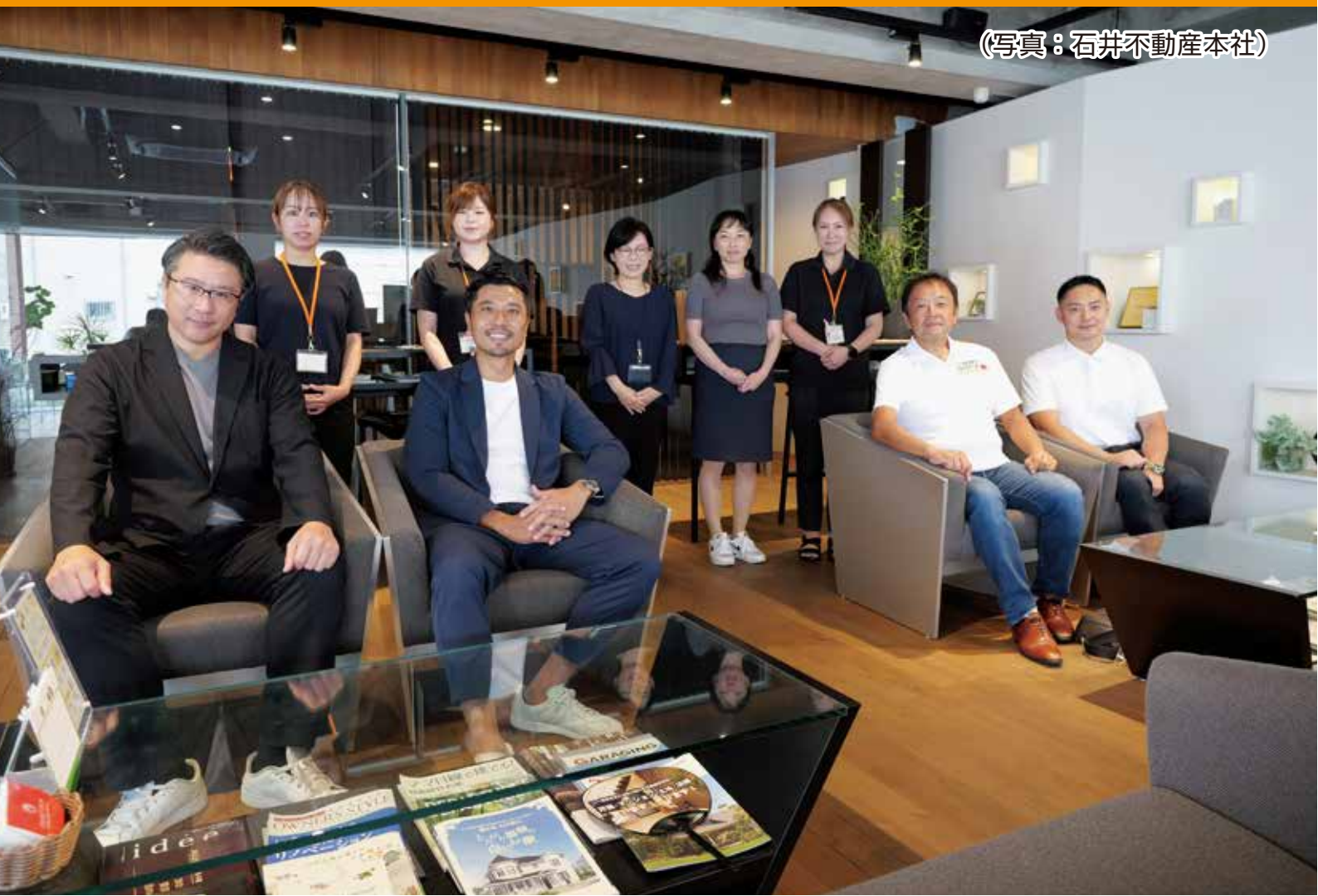
(写真：石井不動産本社)